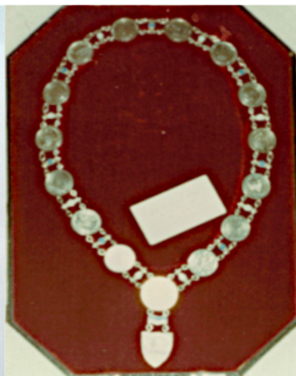
Schaubild 7: Wiedergefundene Amtskette des Bürgermeisters von Simmern