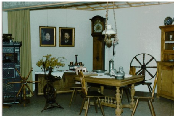
Schaubild 2: Ausstellung 1985 Herrstein