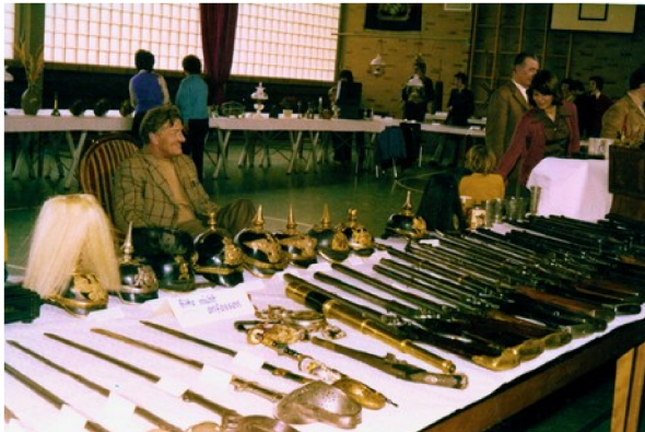
Schaubild 1: Ausstellung 1975 Niederwörresbach