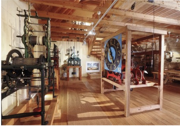
Schaubild 3: Exkursion Turmuhrenmuseum Rockenhausen 2000